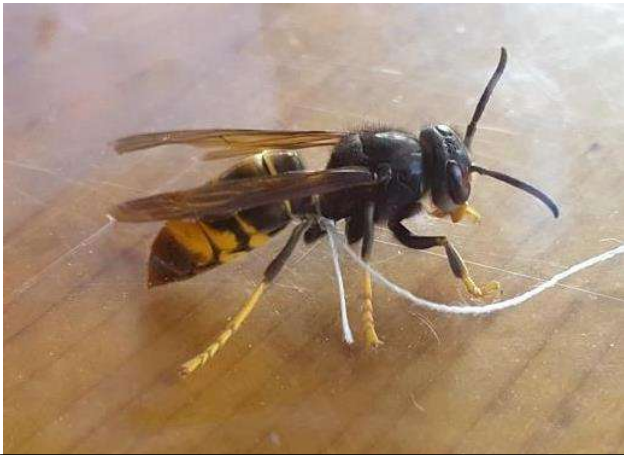
Caractéristiques du frelon asiatique : thorax noir, extrémités des pattes jaunes

Introduit accidentellement près de Bordeaux, le frelon asiatique a colonisé plus de 80 % du territoire français en 15 ans. Après un premier nid découvert dans le Tournaisis, il est actuellement présent partout en Wallonie.